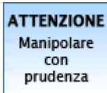
Non classificato m.c.p. (--)